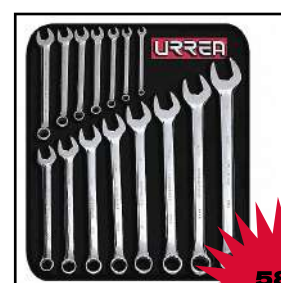
Juego de llaves combianadas