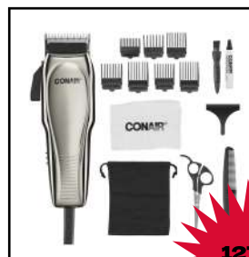
Kit de corte para caballero