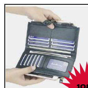
Bolso de mano (monedero)