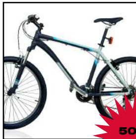
Bicicleta de montaña