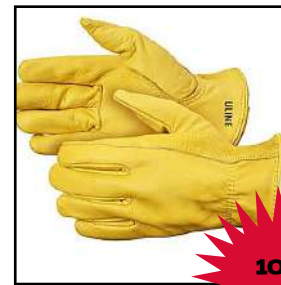
Guantes de carnaza