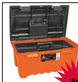
Caja de herramienta