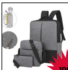
Kit de mochila (3 piezas)